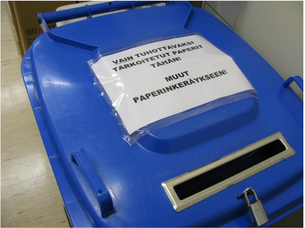
Monistamon tuhottavaksi tarkoitettun paperin keräysroskis.