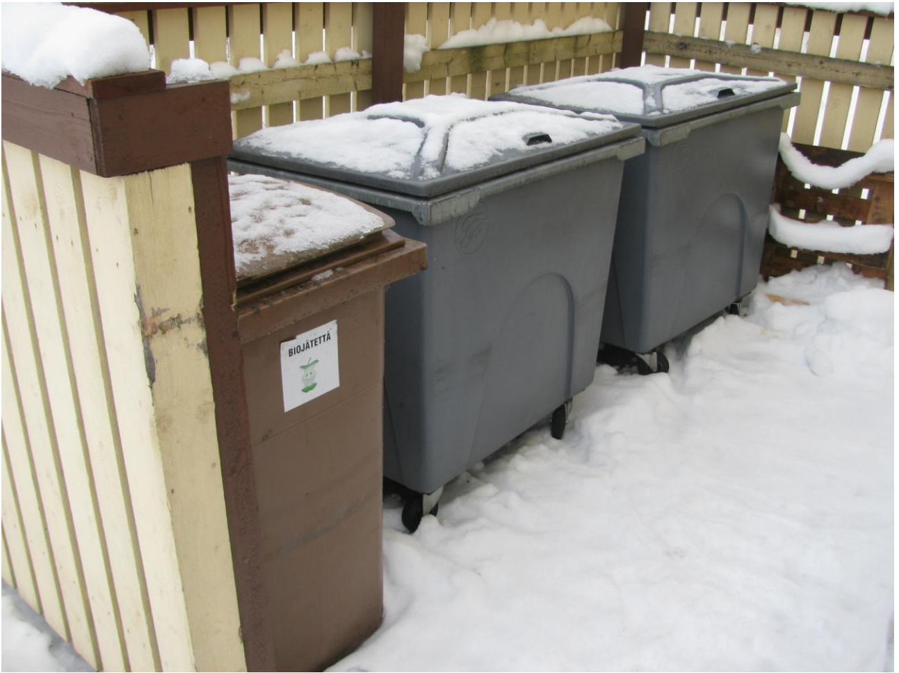
Biojäte ja sekajäte jätteenkeräyspisteet.