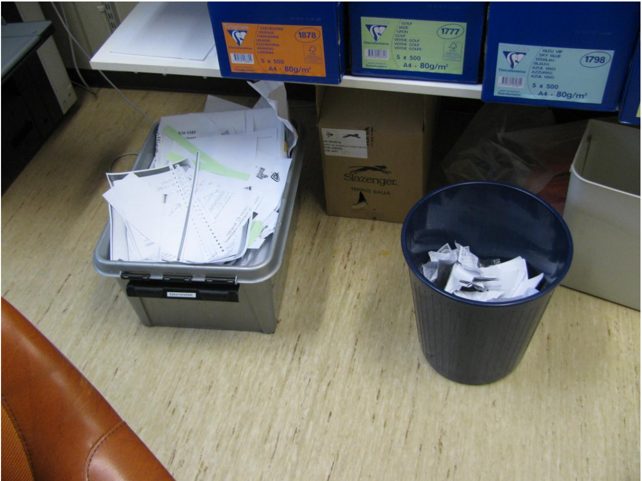
Monistamon sekaroskis ja paperiroskis.