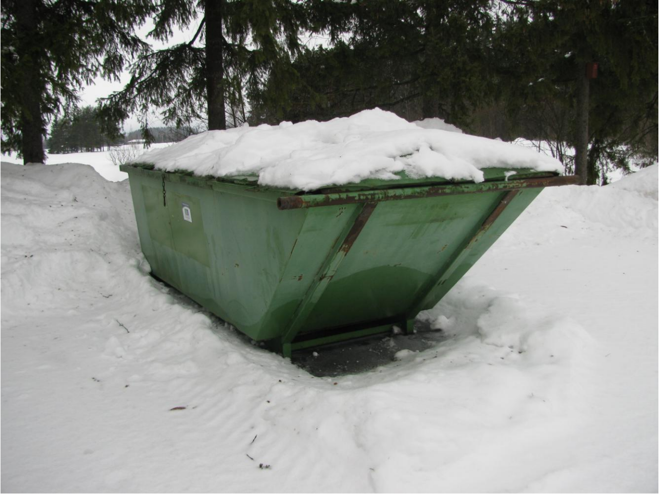
Teknisen luokan takana oleva sekajätteen keräyslava.