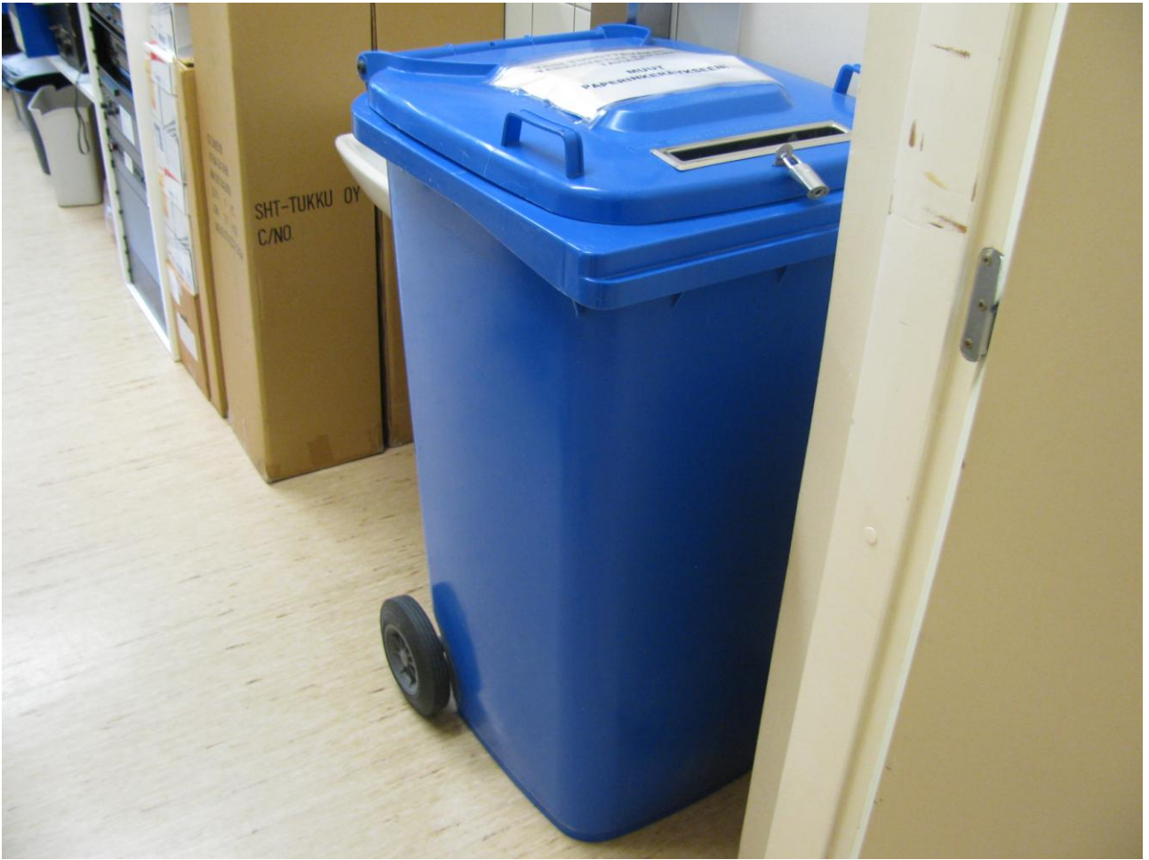
Sama roskis kauempaa.