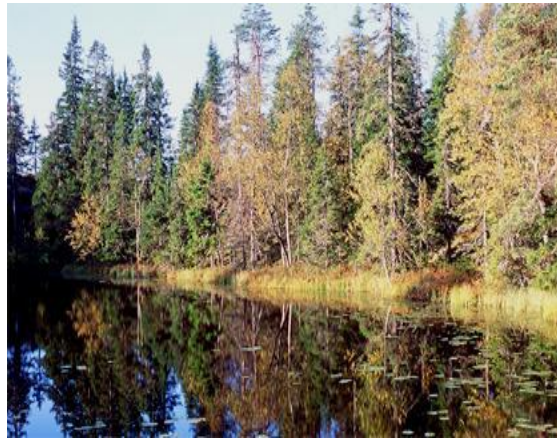
Puut karistavat neulasia happaman veden takia.

Kalkikuoiset eliöt kärsivät happamassa vedessä.