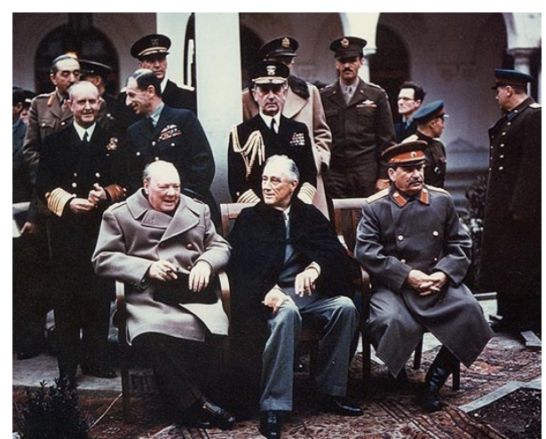
Winston Churchill, Franklin D. Roosevelt i Josef Stalin a Ialta el 1945.

L'epicentre de la conferència era la coordinació militar car es pensava que les tropes aliades haurien de desembarcar al Japó, la qual cosa comportava una enorme pèrdua de soldats i encara que els nord-americans avançaven en les investigacions per a obtenir la bomba atòmica, de moment els estadistes no desitjaven confiar en una arma tan incerta. Inicialment s'havia pensat en la Xina, però amb el temps s'havia pogut constatar l'escàs entusiasme del generalíssim Chiang Kai-shek, la deficient preparació del seu exèrcit i la poca fiabilitat dels seus comandaments. Per això, Roosevelt necessitava la col·laboració de la Unió Soviètica i el seu nombrós exèrcit per a donar el cop de gràcia al Japó, una cosa que semblava impossible, ja que formalment l'URSS i l'Imperi del Sol Naixent no s'havien declarat la guerra.