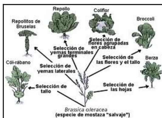
Figura N° 2: Evolución por selección natural