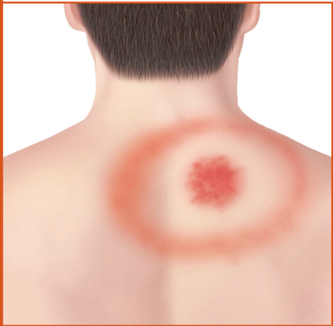
Erupción de "ojo de toro" en la espalda.