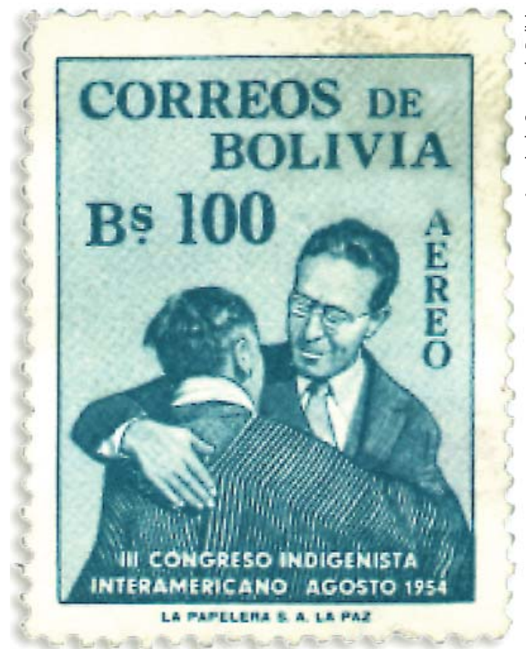
Asimetría indigenista. Un indio desconocido es abrazado por el presidente Siles Suazo.

¿Qué idea de nación conllevaba el indigenismo clásico? Con el objetivo de integrar a los indígenas, la nación era concebida como una comunidad aún en formación, por lo que debían subrayarse todos los rasgos que unificaban, descartando los que podían generar divergencias. En este modelo de nación los gobiernos fomentaban una sola lengua —el castellano o portugués—, una sola religión —la católica—, la idea de un territorio indiviso —la patria— y la noción de una única "raza" —la blanca o al menos el ideal racista del "blaqueamiento". Es tan cierto que la idea de nación ha sido la clave emancipadora del dominio colonial como