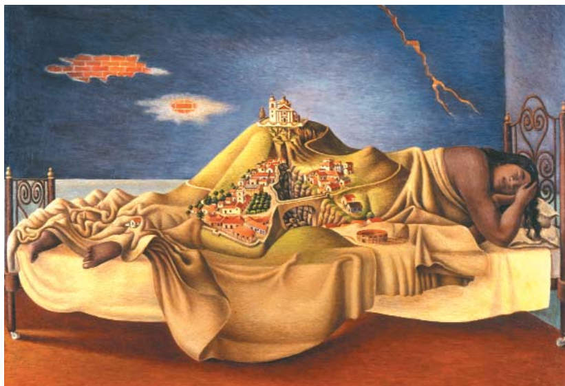
La nación mestiza mexicana y Malinche. Óleo de Antonio Ruiz, Sueño de Malinche , 1939.

Mestizaje es una noción cuyo uso sugiere significados contrapuestos. Del lado "oficial" y del sentido común, el mestizaje es una ideología de fusión de las diferencias (biológicas y culturales). Del lado "crítico", remite a un proceso abierto de diferenciación constante donde no hay punto de fusión, ni crisol posible. Las naciones latinoamericanas edificaron sus ideologías nacionalistas sobre la primera noción de mestizaje, elevando las ideas y valores de lo mestizo –llámese criollo, cholo o ladino– a símbolos de sus nacionalidades. Bajo esta aparente democracia se encubren otras posibilidades identitarias, pero, sobre todo, se desconoce el proceso de diferenciación social y cultural que hace surgir "diferencias" impensadas. El punto clave de esta ideología es el establecimiento de una jerarquía entre los tipos de fusión deseables y los grados de esa fusión. Así, bajo la noción genérica de mestizo puede entrar el patrón criollo –criollo por ser americano–, el profesional liberal "gringo" –criollo por aclimatado o hijo de inmi-grantes–, el mestizo propiamente