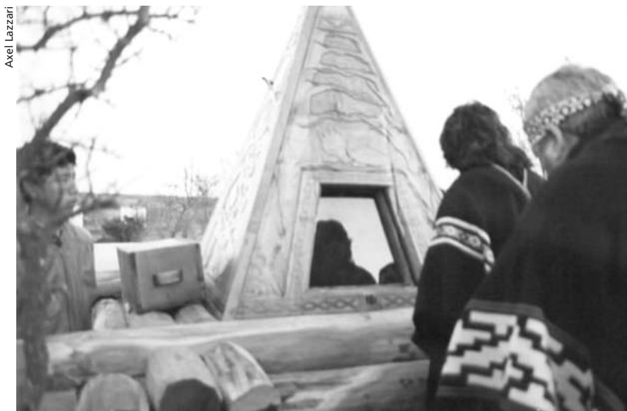
Repatriación de los ancestros. Los ranqueles muestran sus respetos al cacique Mariano Rosas.

Los indígenas no están "politizados" en el sentido peyorativo del término. Sólo quieren hacer cumplir sus derechos y crear otros, pretensión que por cierto exagera prevenciones respecto a que "se pasaron de la raya" o están comenzando a "faltar el respeto". Lo cierto es que los pueblos indígenas están adquiriendo voz y capacidad de acción política para mostrar en un nuevo escenario lo que desde la conquista, ¿infinita?, se impuso como una necesidad: articular una utopía de regeneración en las duras condiciones del despojo.