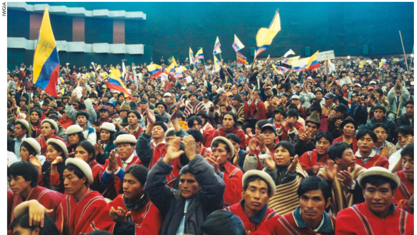
Reemergencia en tierras altas: organizaciones indígenas exigen la renuncia del presidente ecuatoriano Jamil Mahuad en el año 2000.

fomentó violentos procesos de "extracción" de riqueza y trabajo a través de empresas de colonización oficial o privada. En las fronteras, por su condición de tales, una vez más la "civilización" se antepuso como objetivo táctico a la "nacionalización", es decir, se privilegió la "humanización" de los "salvajes" sobre hacerlos "compatriotas". En esto sigue pesando el acendrado prejuicio acerca de los cazadores-recolectores que viven en ese hábitat y que suelen ser descriptos como holgazanes, improductivos y, por ello, mismo "salvajes" en comparación con las "civilizaciones indias" agrícolas y la sociedad industrial. Entre los muchos ejemplos de traducción de estos prejuicios en muertes, cabe mencionar la desarticulación demográfica y cultural de los xavantes luego de la apertura de la ruta transamazónica en el Brasil del milagro setentista o la migración desde los sesenta de los indígenas sin tierra de la sierra peruana, quienes, en busca de "oportunidades de progreso", se emplean en las empresas extractivistas de la selva y terminan enfrentándose con los indígenas que las habitan.