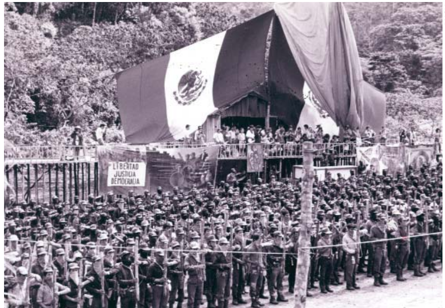
Indios y mexicanos, pero de otro modo. Formación del EZLN ante la bandera mexicana.

El derecho a identidad cultural supone una lucha por afirmarse y afirmar, contra los poderes vigentes, el valor positivo de las costumbres tradicionales y, en especial, las lenguas vernáculas, la espiritualidad y las visiones históricas indígenas. En el siglo XIX, cuando se le dio un sesgo antropológico al sentido de cultura, se pensaba que los indios "tenían" algo de cultura, pero no mucho. En el siglo XX, la antropología pensó que los indígenas constituían "culturas" diferentes, pero luego, por los procesos de colonización, "perdieron" esa diferencia cultural (se asimilaron y aculturaron como "campesinos", "villeros", etc.). Hoy la antropología y las ciencias sociales piensan que la cultura es un proceso de creación y recreación de formas de vida. Los pueblos indígenas se muestran como hacedores de cultura y, más precisamente, de de su identidad a partir de lo que consideran su cultura. Las discusiones en torno a los programas de interculturalidad y bilingüismo en la educación, los proyectos de escrituración de lenguas orales, los talle-