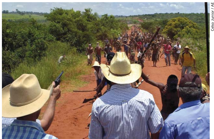
Enfrentamiento por tierras en Brasil.

común del discurso racista del desarrollo, el antropólogo Pacheco de Oliveira ha destacado que la mayoría de las tierras sin producción están bajo control latifundista. Esta circunstancia provoca una presión campesina que se intenta desviar hacia áreas "vacías" pero que, en realidad, están habitadas por indígenas. Por otra parte, la supuesta improductividad de la economía aborigen tiene que ver con que ésta no se orienta a la obtención de una ganancia, sino que se inserta en ciclos de reciprocidad que distribuyen la riqueza socialmente producida. Por eso, el derecho a la tierra, junto con el de autonomía, involucra la posibilidad de diseñar estrategias productivas sustentables basadas en las propias tradiciones culturales (etnodesarrollo). La lucha por territorios indígenas va más allá del reclamo de tierra que, en buena medida, también es extensible a campesinados de memoria no indígena (como los "sin tierra"). Se busca el control de un espacio —un territorio ancestral— que abarca el reclamo de autonomía política. La mayoría de las organizaciones indígenas reclaman territorios autónomos dentro del Estado, lo que implica el desafío de crear modos de ejercer la soberanía estatal más inclusivos y menos homogeneizantes. Este sería el objetivo político de máxima del EZLN, pero lleva un largo tiempo disipar la paranoia de los gobiernos que, con un ojo en las relaciones internacionales, no pueden entender el reclamo territorial más que como la altera-