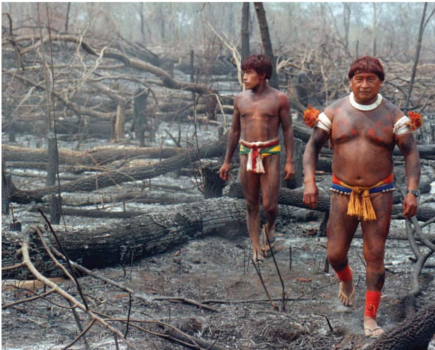
Indígenas deforestados (Brasil).

nes de la reemergencia fue el proceso de reforma del Estado. Hay que entender por ella un momento más del proceso formativo del Estado en América Latina en el que se redefinen los ejes de la dominación social y las coordenadas de gobierno en el contexto de una internacionalización acelerada de mercados, regímenes jurídicos y movimientos de protesta. Así, desde los años noventa puede observarse la paradoja de una "democracia neoliberal" que, mientras por un lado incentiva proyectos de participación, descentralización, autonomía, tolerancia y pluralismo, por otro "ajusta" al máximo la distribución de recursos sociales y económicos en la población. La retórica del Estado "eficiente" se traduce en una creciente marginación de los indígenas como ciudadanos y un veloz deterioro de sus condiciones de reproducción material y cultural. En efecto, han aumentado los ritmos de concentración latifundista en manos privadas (nacionales y extranjeras), pasando por encima de las tierras indígenas (por lo general ya transformadas en minifundios o con títulos precarios) y generando la expulsión de grandes números de campesinos que van a las ciudades, al extranjero o quedan como población "sin tierra". Esto, a su vez, provoca la baja de salarios y a la expansión del hambre en el