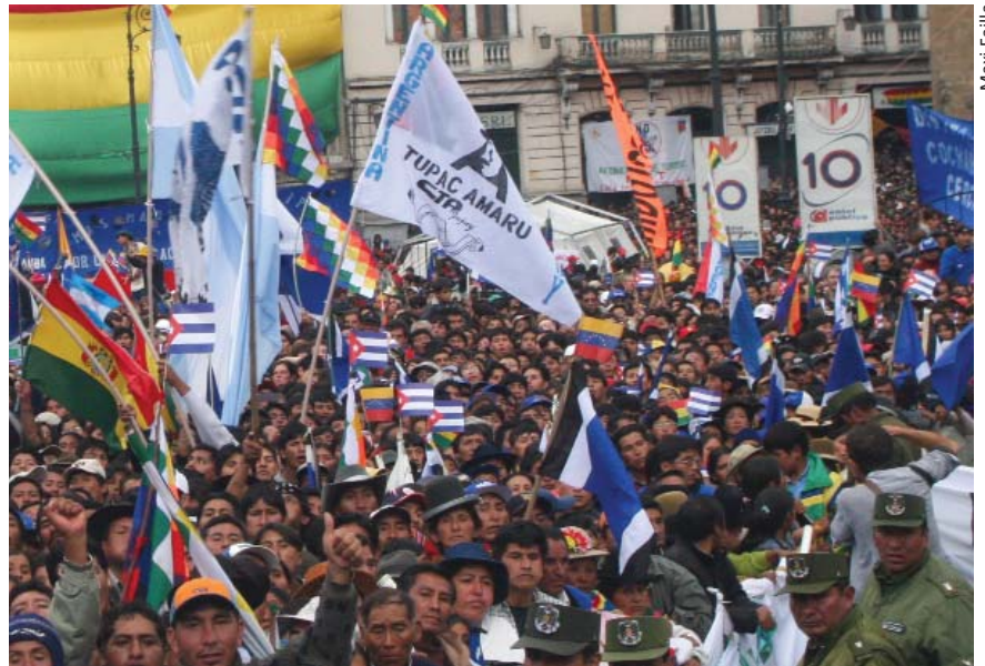
La Wipala, símbolo del movimiento indígena, entre otras banderas en una protesta.

El activismo indígena actual se distingue de otros episodios de reemergencia porque busca articularse en pie de igualdad con otros movimientos sociales sin que se diluya su identidad ni su protagonismo. Asimismo,