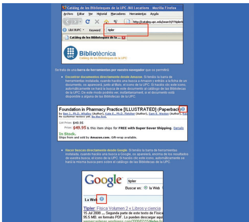
Herramientas de búsqueda (traducción automática a través de InterNostrum)

http://bibliotecnica.upc.es/bib160/serveis/qr/