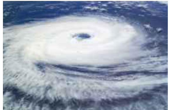
Immagine del ciclone Bhola del 1970.

Oggi il livello di sicurezza e la preparazione ai disastri naturali è senz'altro migliorata, basti pensare che nel maggio 2013 la tempesta tropicale Mahasen ha avuto un bilancio ufficiale di soli 18 morti anche se si è abbattuta in una zona popolata da un milione di persone. Persistono comunque, gli ingenti danni subiti da 400mila persone, soprattutto nel settore dell'agricoltura.