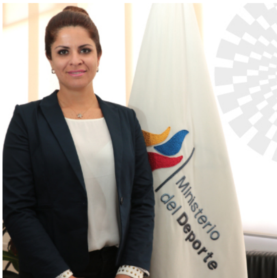
Andrea Sotomayor - Ministra del Deporte

Quito (Pichincha).- Mediante Decreto Ejecutivo Número 8, emitido el 24 de mayo por el presidente de la República, Lenín Moreno, se declara a la economista Andrea Daniela Sotomayor Andrade como la Ministra del Deporte para el presente periodo.