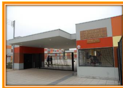
2008 a la fecha comuna de La Cisterna.