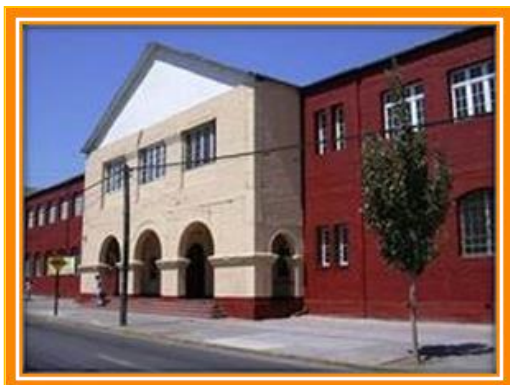
1924-2007 comuna de San Miguel.

El censo de 2012, en información preliminar registró 80.910 habitantes, población urbana 100%, actualmente está compuesta principalmente por estratos socio-económicos bajos, debido a la migración de las antiguas familias y por el surgimiento de nuevas viviendas sociales.