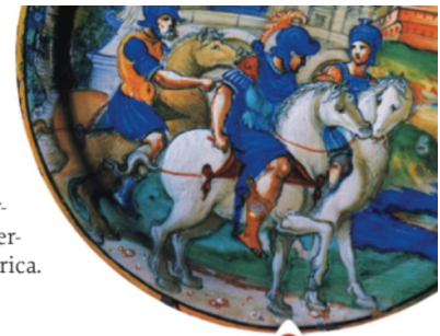
Il sacco di Roma in una raffigurazione immaginaria.

Nel 1519, però, l'equilibrio di forze così raggiunto fu sconvolto da un fatto imprevisto: il giovane re di Spagna Carlo d'Asburgo ottenne la corona imperiale con il nome di Carlo V 1 . Carlo aveva già ereditato un gran numero di regni e di signorie e, dopo l'elezione, il suo potere si estendeva su Austria, Boemia, Germania meridionale, Paesi Bassi, Spagna, domini spagnoli del Mediterraneo (Napoli, Sicilia, Sardegna, Baleari) e colonie spagnole d'America.