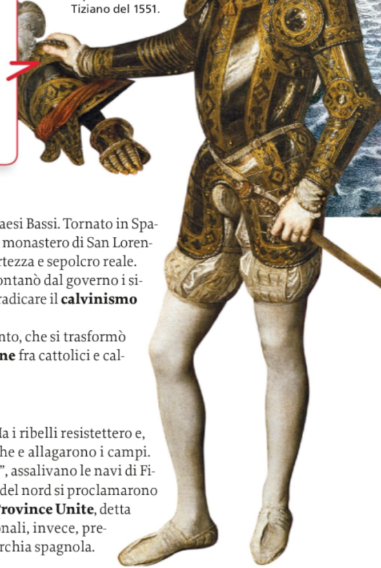
Filippo II. Dipinto di Tiziano del 1551.

Speciali permessi che i sovrani rilasciavano ai marinai (detti perciò corsari ), autorizzandoli ad assaltare le navi dei Paesi nemici.