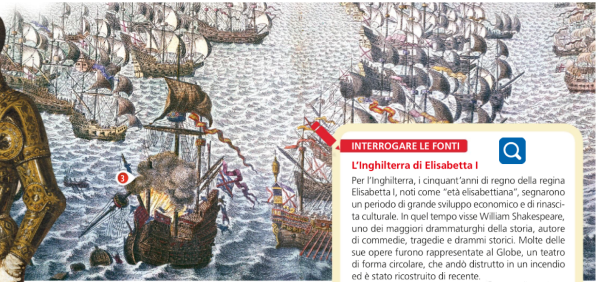
L'Invencible Armada. Dipinto del 1605.

lettere di corsa che li autorizzavano ad assalire e depredare le navi spagnole cariche dell'argento americano.